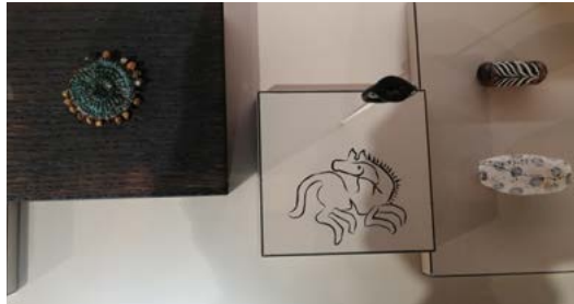
Bijoux, métal, verre, corail