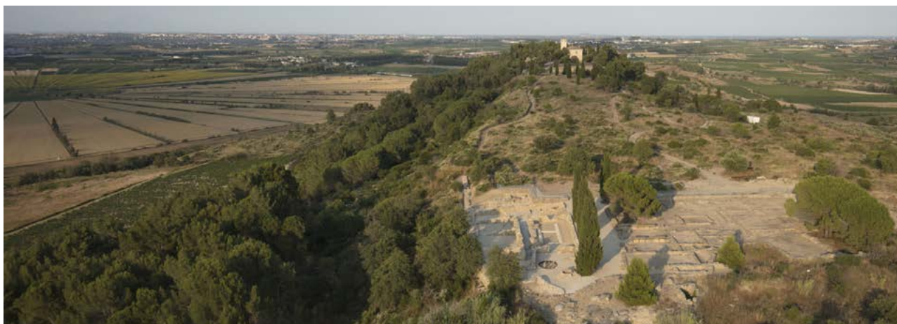
Vue aérienne du site

Après de longs mois de travaux, le musée a réouvert ses portes en juillet 2022. L'occasion de redécouvrir ce magnifique site et ses collections, incontournables.