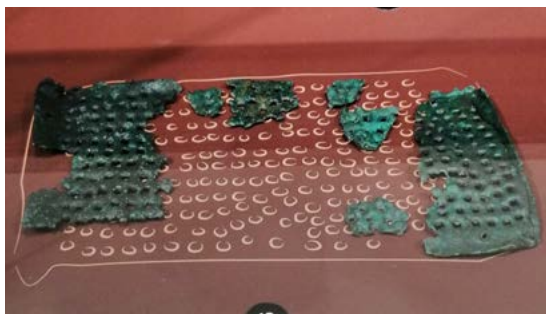
Râpe à fromage d'origine grecque (pour mettre dans le vin !)