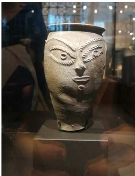
Vase de fabrication locale.

Mobilier remis en place comme lors de la découverte. Sépulture double avec armement : 1er dépôt v. -275 ; 2e dépôt v. -225. Propositions de reconstitutions ci-dessous.