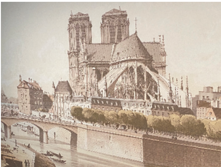
Lithographie de Féodor Hoffbaer « La cathédrale Notre Dame de Paris et le palais de l'archevêque en 1595 »

Fermée depuis l'incendie, la crypte a réouvert ses portes. À côté des vestiges antiques, le musée nous propose de (re)découvrir la cathédrale au travers du roman de Victor Hugo.